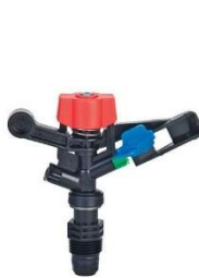
樹脂スプリンクラー 5022SD