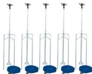
スプリンクラーホースセット 口径40A・二脚・5本立 18セット （樹脂スプリンクラー5022SD 90基）