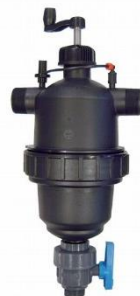
プラスチックフィルター ニュー2Tブラシ

スプリンクラーのノズルにゴミが詰まらないように、フィルターを設置していただいております。